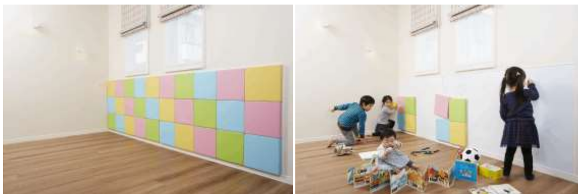
カメレオンクッション

なおこの商品は、毎年アイフルホームが全国のFC加盟店及び一般の方から「キッズデザイン」のアイデアを募集する「キッズデザインアイデアコンテスト」(旧名称:キッズデザイン&低炭素コンテスト)で2015年に上位入賞した作品「カメレオンクッション」をもとに商品化したものです。