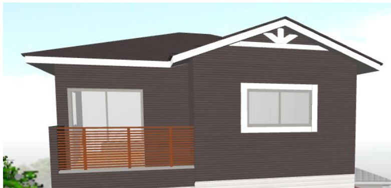
窓モールが入力されます