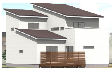
アイフルホーム福島北店 延床面積 114 ㎡

このたび 4 月 29 日(祝)にオープンするのは、アイフルホーム福島北店・東和総合住宅(株)・(株)土屋ホーム・(株)松浦建工所・(株)ウェルズホーム福島・(株)創作家・セルコホーム(株)が新築したモデルハウス 7 棟。全棟は、前述した「家並み創造」の要件を満たし、各社、個性豊かに外観や間取り、設備・仕様の工夫を施し快適な暮らしの提案と環境負荷低減に貢献します。