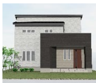
(株)土屋ホーム 延床面積 107.85 ㎡