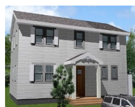
セルコホーム(株) 延床面積 115.96 ㎡

戸建街区「ソラチエ」では、モデルハウス棟のオープンに際し、『まちびらきフェスタ』をGW 中の 4 月 29 日～5 月 1 日の 3 日間開催いたします。同フェスタでは、モデルハウス棟の一斉見学会を行うと共に、地域連携として、福島市や伊達市にある飲食店・物販店・農家などが集う「マルシェ」を出店するほか、福島学院大学の学生による「未来の街づくりワークショップ」や、地元を拠点に活動するバンドによる演奏が行われます。