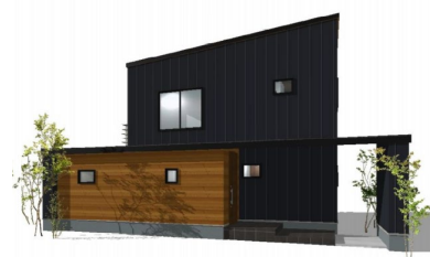
(株)松浦建工所 延床面積 118.5 ㎡