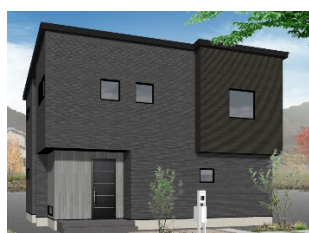
東和総合住宅(株) 延床面積 118.82 ㎡