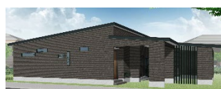
(株)創作家 延床面積 132.91 ㎡