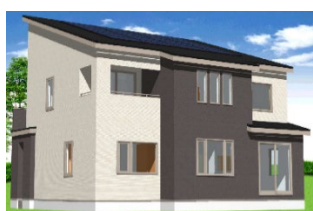
(株)ウェルズホーム福島 延床面積 113.85 ㎡