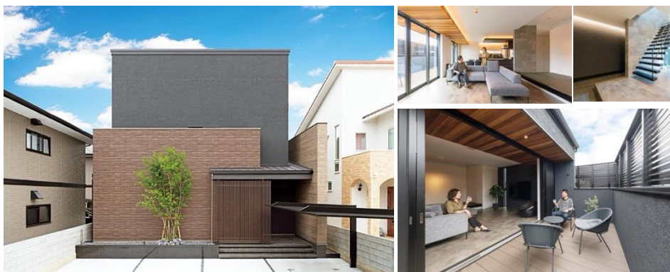
金賞「二階リビングの家」加盟店:アイフルホーム徳島北店