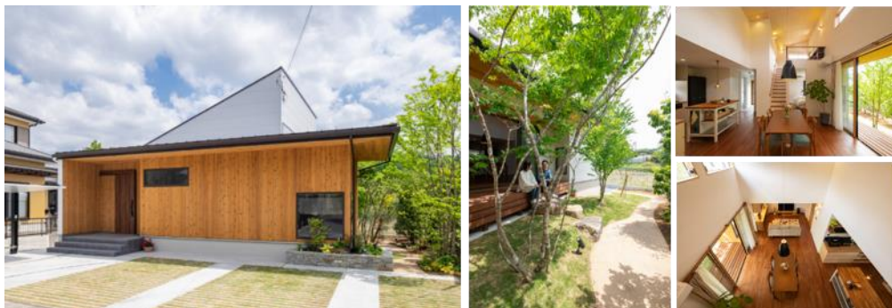
金賞「庭を楽しむ家」加盟店:アイフルホーム沼津店