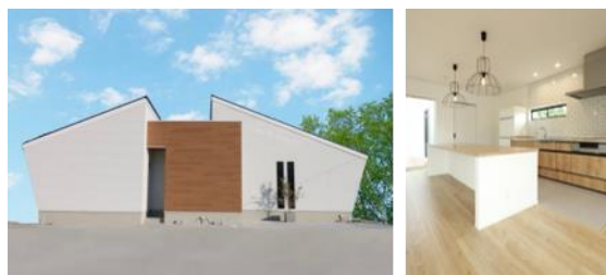
銀賞「『中庭』を楽しむ家」加盟店:アイフルホーム徳島北店