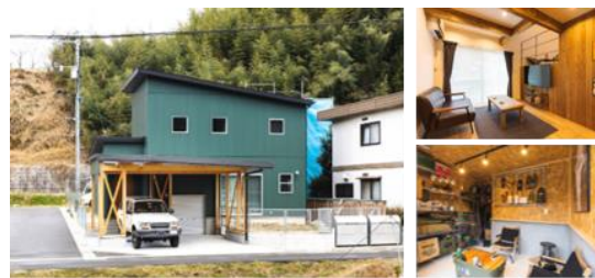
銅賞「趣味を楽しめる家」加盟店:アイフルホーム松江店