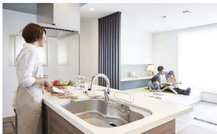
For KIDS #子育てを楽しむ家

株式会社LIXIL住宅研究所は、特定非営利活動法人キッズデザイン協議会(本部:東京都港区)主催の「第16回キッズデザイン賞」の「子どもたちの安全・安心に貢献するデザイン部門」において、『For KIDS #子育てを楽しむ家』、『停電対策住宅(日東エルマテリアル(株)、ニチコン(株)との共同開発)』、『安心すこやか階段(朝日ウッドテック(株)との共同開発)』の計3作品が、子どもの安全・安心に寄与する製品、建築・空間などとして評価され、キッズデザイン賞を受賞しました。