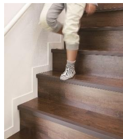
安心すこやか階段